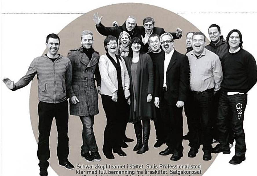
Schwarzkopf teamet i støtet. Solis Professional stod klar med full bemanning fra årsskiftet. Salgskorpset får nok å gjøre for å innfri vekstambisjonene for Schwarzkopf Professional.